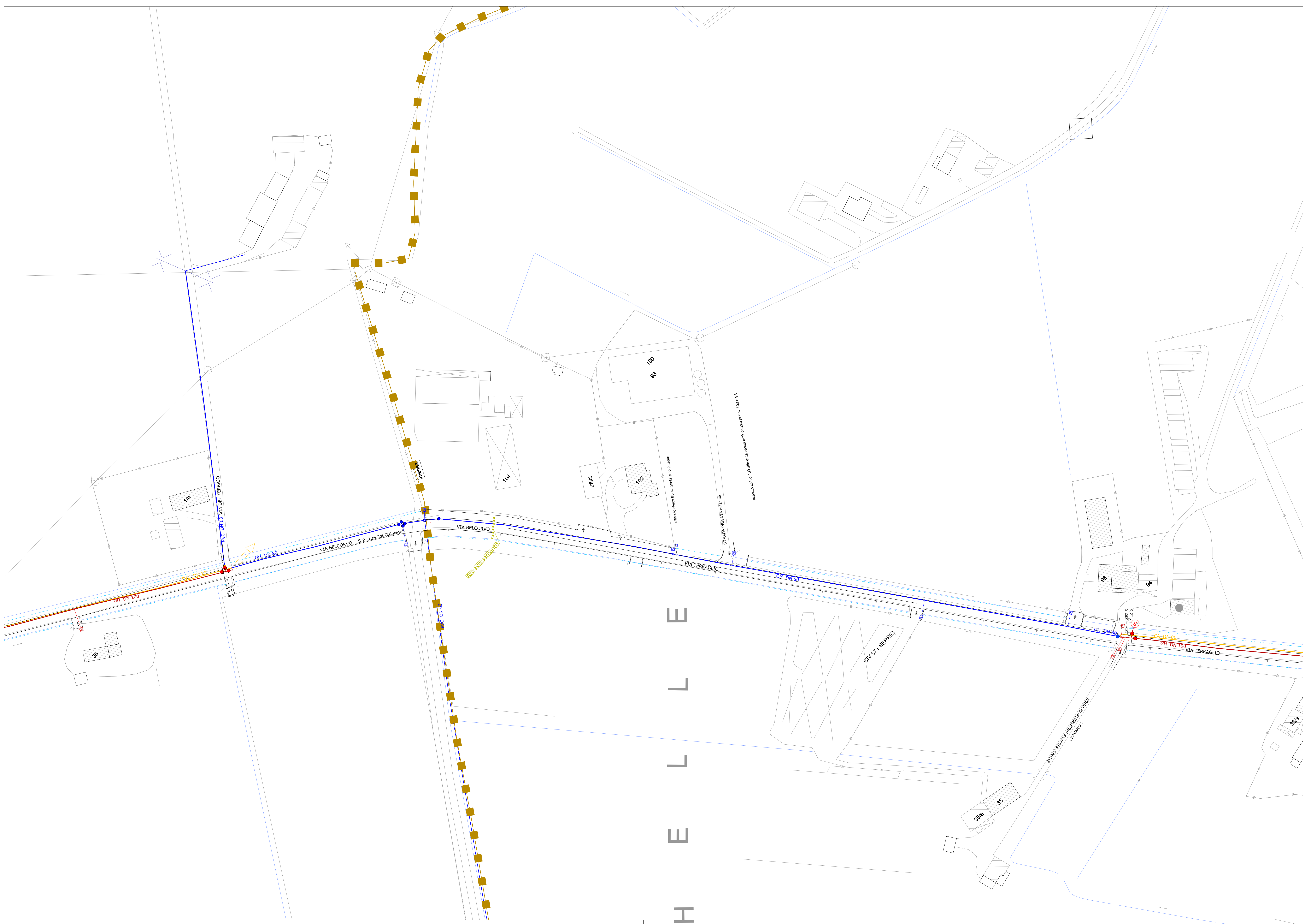
QUADRO DI UNIONE